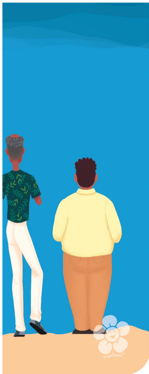
Image extraite du guide « Lyannaj 10 voies pour parler du handicap »